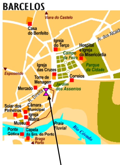
Biblioteca Municipal de Barcelos

A Biblioteca Municipal de Barcelos é um centro multimédia, gratuito e de acesso livre que tem como principais objectivos a educação, a informação, a cultura e o lazer, segundo princípios de igualdade, liberdade, prosperidade e desenvolvimento enunciados no Manifesto da UNESCO sobre Bibliotecas Públicas. É um local agradável e informal, que dispõe de óptimas instalações, mobiliário confortável, fundos actuais diversificados e técnicos especializados.